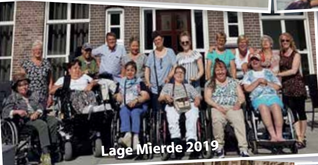
Lage Mierde 2019