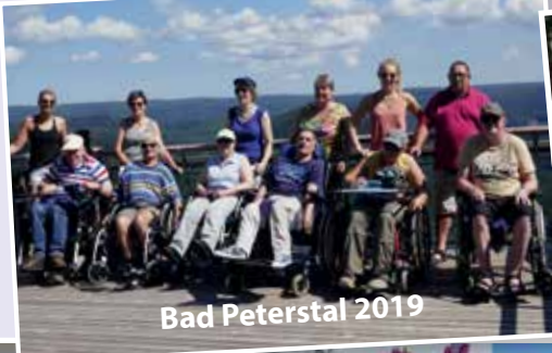
Bad Peterstal 2019