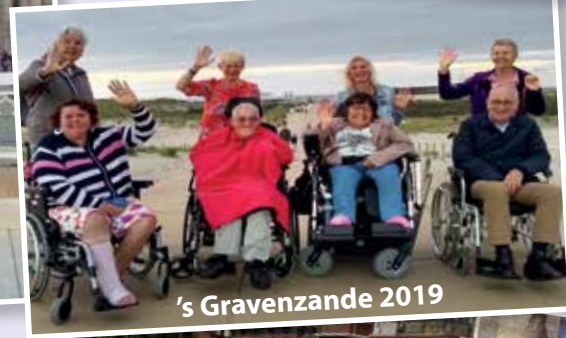
's Gravenzande 2019